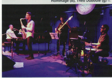
No Square Jazz Quartet CAPTURE VIDEO